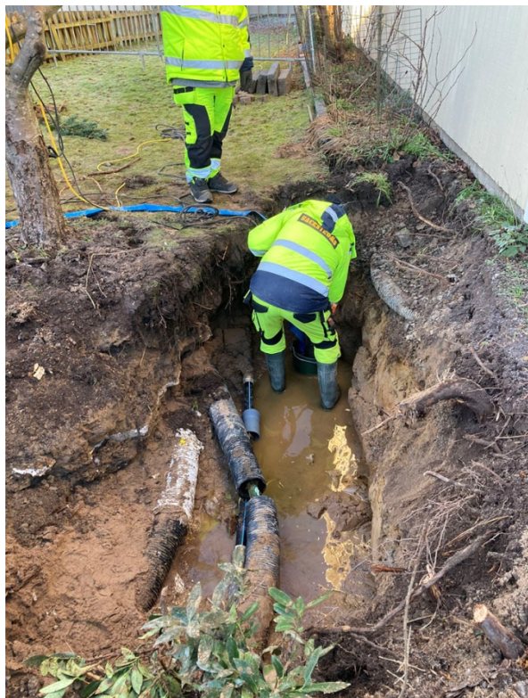
Här är vattenläckan lokaliserad och reparerad.

Samfälligheten måste bekosta reparationen av vattenledningen och den kostnaden tas från vår gemensamma fond. Vattenfall tar alla kostnader för reparationen av fjärrvärmeledningen.