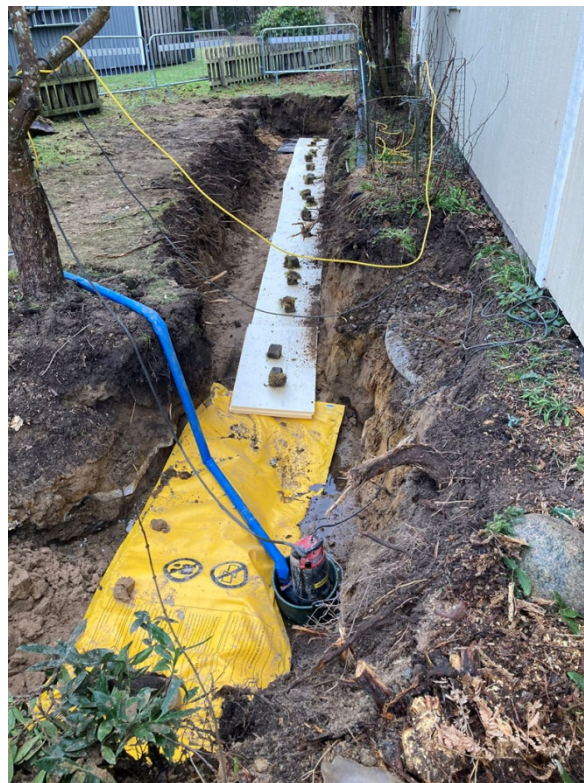
Här är 8-10 meter av fjärrvärmeledningen utbytt. Syns inte, men ligger under isoleringsskivorna.